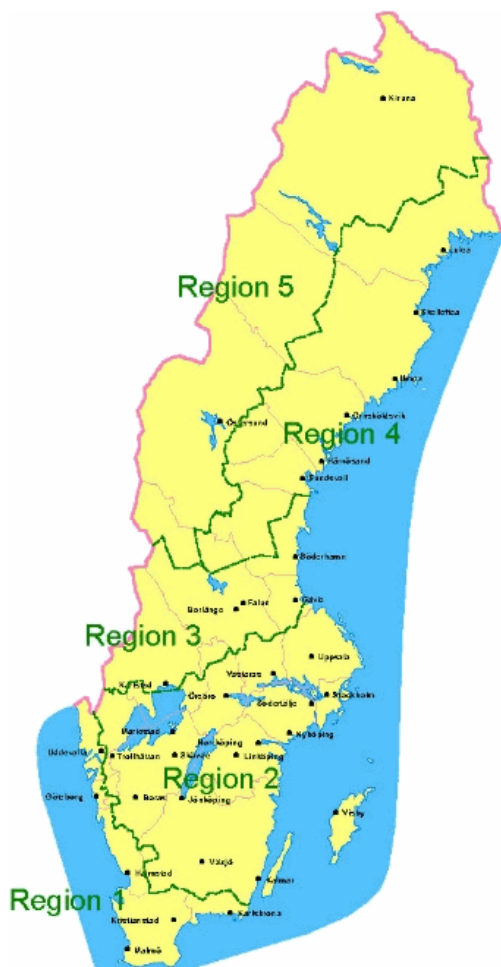
Regionsindelning i hela landet