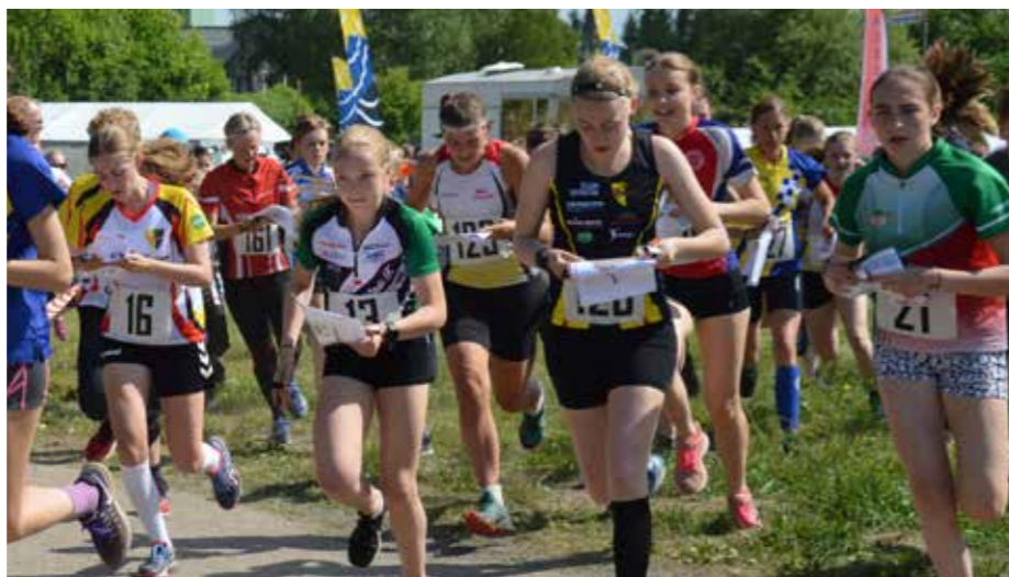
Solen sken när Skene SoIS bjöd in till distriktets första distriktsmästerskap i sprintstafett, en tävlingsform som de flesta verkade tycka var både rafflande och rolig.

Återigen var det Skene SoIS, men nu tillsammans med OK Mark, som var värdar. Dock blåste natt-DM bort då en hotande storm över Västsverige var på väg in och alla uppmanades att inte ge sig ut på vägarna. Då togs det rätta beslutet att ställa in tävlingen. Tyvärr fanns det ingen annan