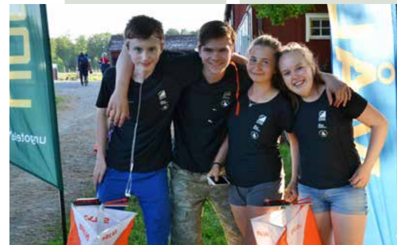
Över 100 starter gjordes när Lidköpings ungdomar bjöd på sprinttävling.

Ungoteket är utbildningen där unga orienterare från 14 år, får lära sig att skapa och leda orientering. De nya kunskaperna används till att göra ett valfritt projekt i föreningen, kanske en tävling eller ett läger. Ni som är med väljer själva er utmaning!