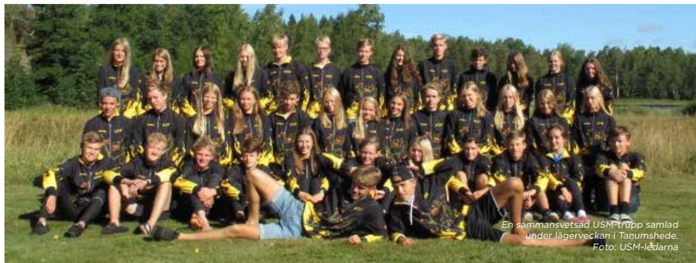
En sammansvetsad USM-trupp samlad under lägerveckan i Tanumshede.