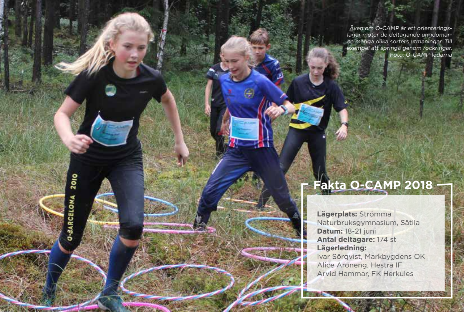
Även om O-CAMP är ett orienteringsläger möter de deltagande ungdomarna många olika sorters utmaningar. Till exempel att springa genom rockringar.