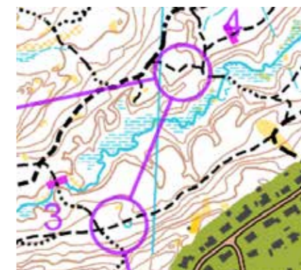
En av de vägvalssträckor som H60-åkarna möttes av under DM i MtbO i Trollhättan.