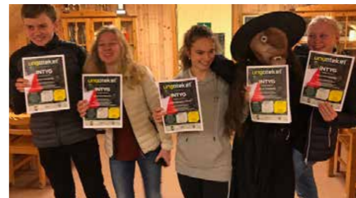
Här får gänget från OK Skogsvargarna (och Häxjaktshäxan) sina intyg.