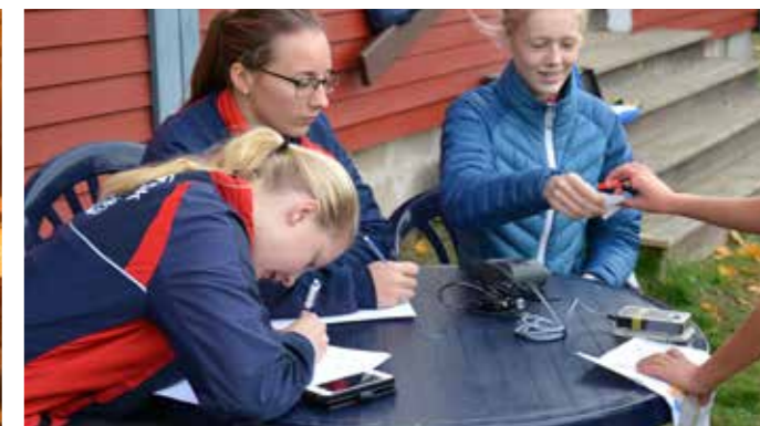
Tre banor med olika längd och svårighetsgrad fanns att välja på när Istrumsgänget bjöd in till uppskattad klubbträning.