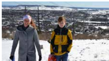
Mösseberg visade upp sin vackraste sida i samband med banlägningsutbildningen.

Deltagarna hade sedan gott om tid att ladda om inför träffen om banläggning som genomfördes 17 mars i Skatås i Göteborg och 28 mars på Mösseberg i Falköping. Som vi alla minns låg snön kvar länge och vid båda träffarna blev det banläggning på vitt underlag.