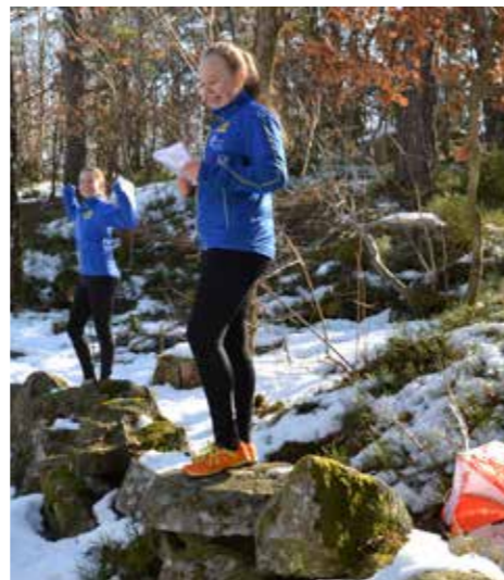
Även i Skatås sken solen på snön och deltagarna.