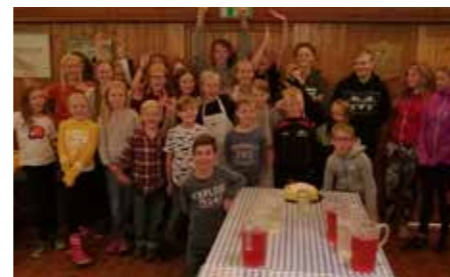
Skogshjortarna firade segern i Västgötatoppen med uppskattat tårtkalas i klubbstugan.