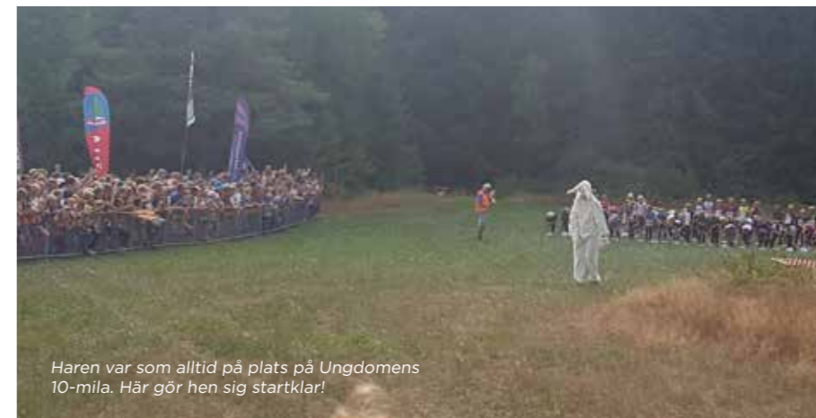
Haren var som alltid på plats på Ungdomens 10-mila. Här gör hen sig startklar!