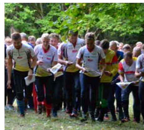
OK Skogshjortarna var även med i Ungoteket 2018 och genomförde där en masstartsträning.