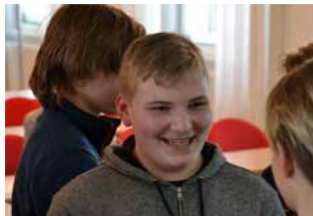
Många glada miner när Ungoteket-året inleddes i Vara, med info och många övningar.

3-4 februari samlades hela gänget i Vara, samtidigt som den sedvanliga Utbildningshelgen arrangerades. Där väntade tre olika teman för deltagarna: Arrangera, Orienterings-IT och Ledarskap. Med träning, tävlingar i gymnasiksalen och övernattnin på det blir det lätt att förstå att helgen var fullspäckad.