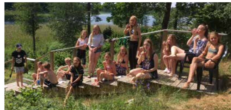
IK Gandviks sommarstuga fick agera lägerplats när klubbens ungdomar bjöd in till ett roligt läger med bad och fina träningspass.