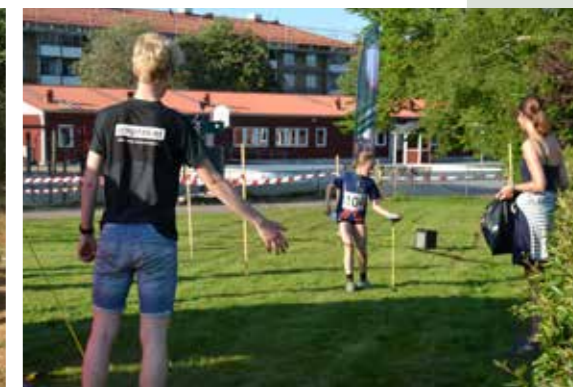
Killarna från Sävedalens AIK och Göteborg-Majorna OK var först ut med att genomföra sitt projekt.