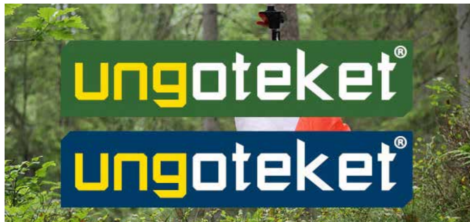
Nu finns det två logotyper för Ungoteket. Grön gäller för Klubb och blå för Riks.