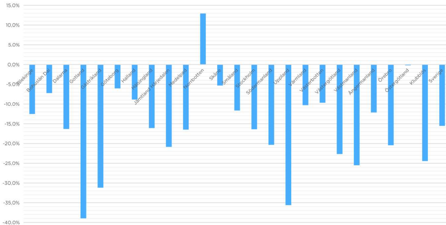
Förändring av antal starter 2019 jämfört med 2022